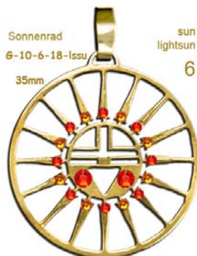
Sonnenrad G-10-6-18-Issu 35mm sun lightsun 6

24kt vergoldet Perlmutscheibe ohne Kristalle