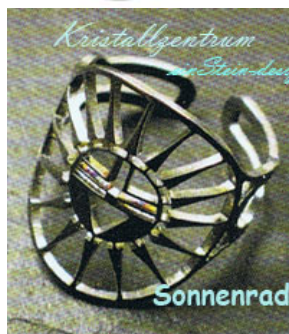
Kristallzentrum einStein-design Sonnenrad