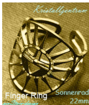
Kristallzentrum Finger Ring Sonnenrad 22mm